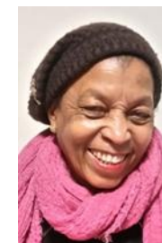
Ninotte Liber Equipe liturgique Fleurs